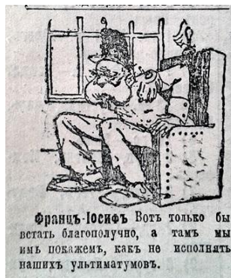
Рис. 2. Франц-Йосиф (Последние новости. 2 августа 1914 г. № 2506)

Початок світового конфлікту в Російській імперії ознаменувався широкою пропагандою міфу про “другу вітчизняну війну”. ЗМІ активно проводили порівняння та алегорії між подіями 1914 та 1812 рр. Карикатуристи надавали Вільгельму