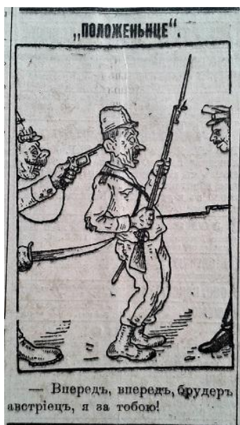
Рис. 8. Положеньце (Южная копейка. 1916. 3 июля. № 1916)

Разом з тим, окремі карикатури були присвячені ставленню німецького імператора до лідерів інших країн Четверного союзу. Зокрема, в одній із них турецького султана зображено у вигляді маріонетки, якою вдало маніпулює Вільгельм II (рис. 9) [13, с. 4]. Інша карикатура відображала характер відносин між Німеччиною та Болгарією: німецький кайзер штовхає болгарського царя і наказує йому беззаперечно коритися (рис. 10) [14, с. 3]. У суспільній думці утверджувалась ідея про нерівноправність союзницьких відносин між країнами Четверного союзу і, що для Німеччини Туреччина та Болгарія виступали лише джерелом матеріальних і людських ресурсів у війні за світове панування.