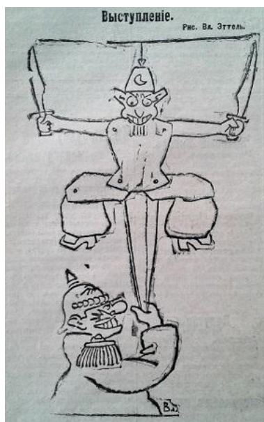
Рис. 9. Выступление (Последние новости. 1914. 23 октября. № 2660)