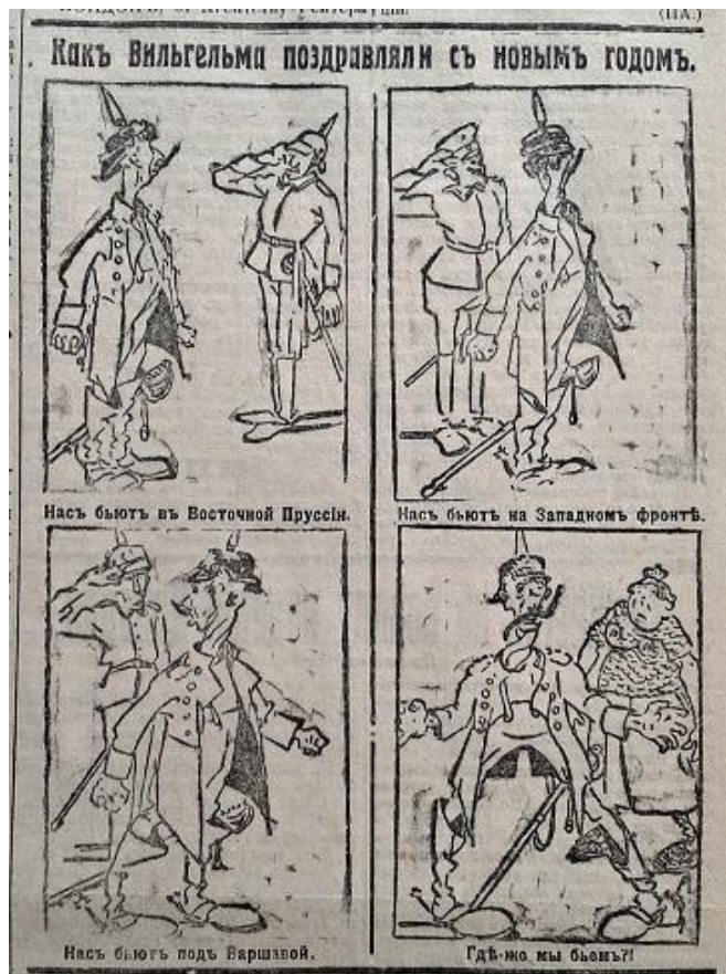
Рис. 11. Какъ Вильгельма поздравляли с новым годом (Южная копейка. 1915. 5 января. № 1424)