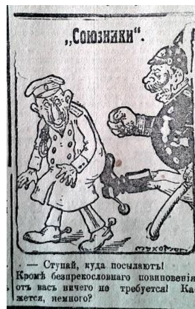
Рис. 10. Союзники (Южная копейка. 1916. 24 января. № 1853)

Одним із тематичних напрямків карикатур було демонстрування факту постійних військових невдач ворога. Наприклад, в газеті “Южная копейка” була розміщена ілюстрація “Як Вільгельма привітали з новим роком” на якій відображено донесення німецького офіцера імператору про поразки на різних ділянках Західного та Східного фронтів і реакція кайзера на такі факти: “Нас б’ють у Східній Пруссії. Нас б’ють на Західному фронті. Нас б’ють під Варшавою. А де ж ми б’ємо?!” (рис. 11) [15, с. 3].