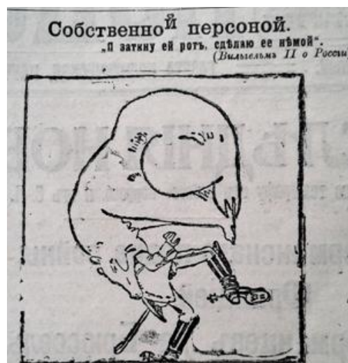
Рис. 4. Собственной персоной (Последние новости. 30 июля 1914 г. № 2499)

Для підсилення ефекту сприйняття побаченого та надання зображенню символічного контексту авторами сатиричної графіки застосовувався прийом зооморфної алегорії, тобто уподібнення до тварин. Карикатура “Собственной