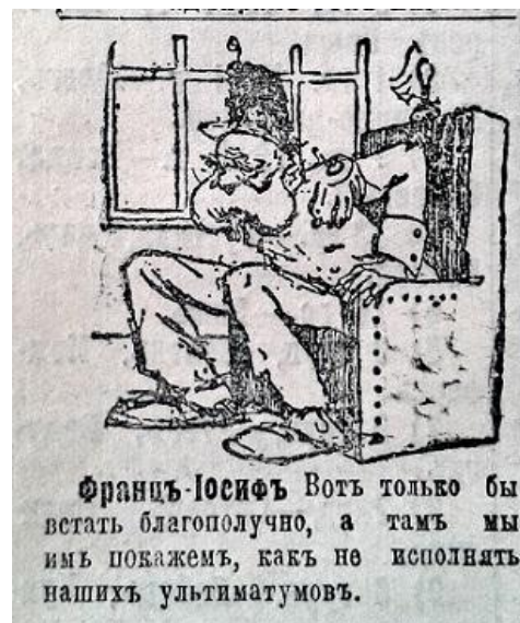
Рис. 2. Франц-Иосиф (Последние новости. 2 августа 1914 г. № 2506)

Початок світового конфлікту в Російській імперії ознаменувався широкою пропагандою міфу про “другу вітчизняну війну”. ЗМІ активно проводили порівняння та алегорії між подіями 1914 та 1812 рр. Карикатуристи надавали Вільгельму