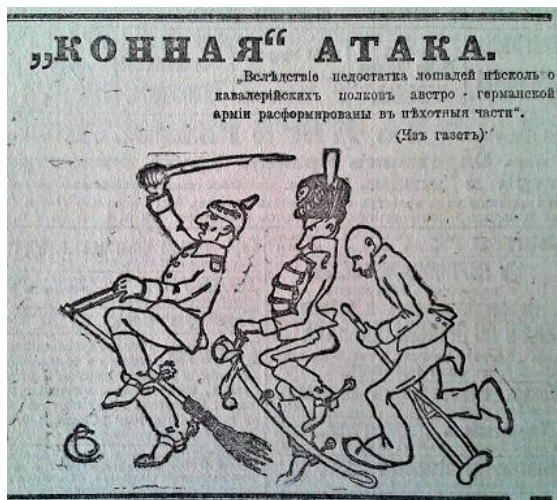
Рис. 13. “Конная” атака (Южная копейка. 4 сентября 1916 г. № 2074)

Період кінця 1916 початку 1917 рр. відзначився появою у ЗМІ значної кількості матеріалів, що відображали складне внутрішньополітичне та військовоє становище ворога. Автори публікацій та зображень наголошували, що Німеччина та її союзники відчувають значний дефіцит продовольчих запасів, фуражу, озброєння та інших необхідних речей для ведення військових дій. Яскравим прикладом подібного пропагандистського матеріалу є карикатура “Кінна” атака”, в якій відображено та висміяно факт відсутності достатньої кількості коней для австро-німецької кавалерії (рис. 13) [17, с. 2].