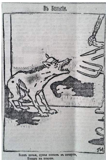
Рис. 6. В Бельгии. “Вовк у ночі, думаючи попасти у вівчарню, попав у псарню” (Последние новости. 7 августа 1914 г. № 2516)

Досить часто зооморфні алегорії використовувалися карикатуристами для позначення ворожих Росії держав. В основному їхній зміст спрямовувався на висвітлення негативних аспектів ворога та демонстрування його хиткої позиції у війні. Так, на одній із карикатур Німеччина була представлена в образі орла, становище якого у ході війни змінюється: від сильного та здорового до покаліченого та перебинтованого (рис. 5) [9, с. 1]. В іншій ілюстрації для позначення німецької сторони використано алегорію вовка, якого супротивники за допомогою вил, кийка та штика загнали у безвихідне становище: “Вовк у ночі, думаючи попасти у вівчарню, попав у псарню” (рис. 6) [10, с. 4]. Подібні сюжети переконували читача в тому, що становище ворога є складним і незабаром, через значний опір підкорених народів та натиск країн-членів Антанти, Німеччина та її союзники зазнають поразки.