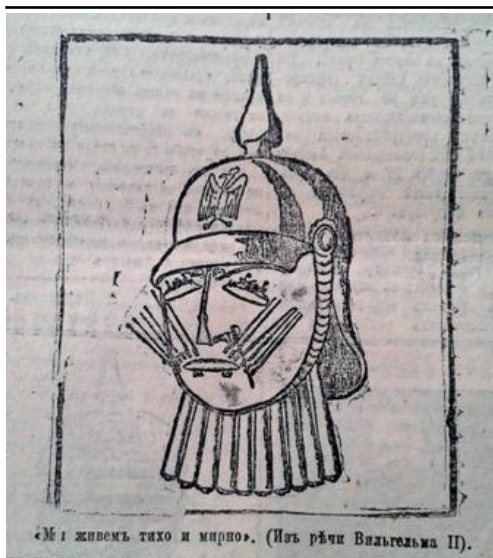
Рис. 1. Мы живем тихо и мирно (Последние новости. 30 июля 1914 г. № 2499)

ІІ характерних рис Наполеона Бонапарта та пророкували німецькому кайзеру таку ж саму долю, якої колись зазнав французький імператор – поразку та заслання (рис. 3) [7, с. 2].