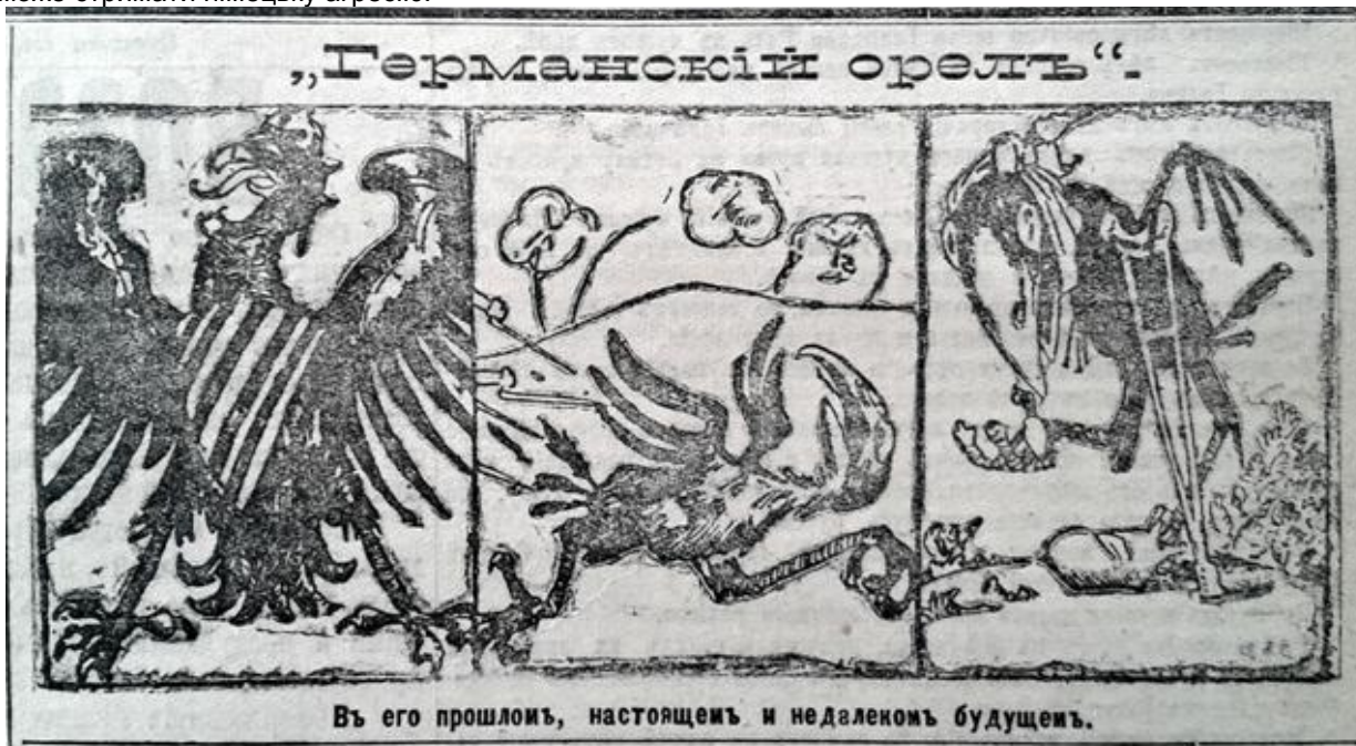
Рис. 5. “Германский орел” (Последние новости. 7 августа 1914 г. № 2516)

ходять ведмеді і, що вона є носієм грубої сили [1, с. 85]. Фактично, образ ведмедя для всіх західноєвропейських держав був універсальним “замінником” Росії, який позначав її дикість, ненаситність, рабський характер, відсталість тощо [2, с. 103–104]. Проте, в самій Російській імперії така зооморфна алегорія була трансформована у позитивно-закономірне явище. Образ ведмедя набув ідеологічно-символічного значення й трактувався як прояв сили, міцності та незламності і, що під час війни тільки він може стримати німецьку агресію.