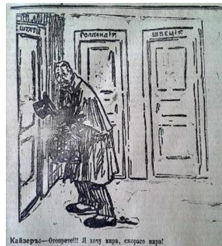
Рис. 14. “Конная” атака (Южная копейка. 8 января 1917 г. № 2196)