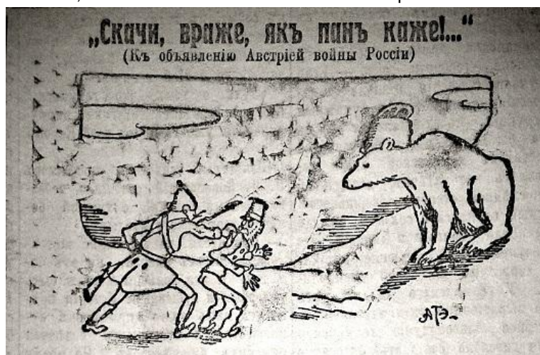
Рис. 7. Скачи, враже, як пан каже (Последние новости. 1914. 3 августа. № 2508)

Значна частина тогочасної сатиричної графіки була присвячена дискредитації та висміюванню відносин між німцями та їхніми союзниками. У карикатурі “Скачи враже, як