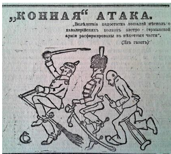
Рис. 13. “Конная” атака (Южная копейка. 4 сентября 1916 г. № 2074)

Період кінця 1916 початку 1917 рр. відзначився появою у ЗМІ значної кількості матеріалів, що відображали складне внутрішньополітичне та військове становище ворога. Автори публікацій та зображень наголошували, що Німеччина та її союзники відчувають значний дефіцит продовольчих запасів, фуражу, озброєння та інших необхідних речей для ведення військових дій. Яскравим прикладом подібного пропагандистського матеріалу є карикатура “Кінна” атака”, в якій відображено та висміяно факт відсутності достатньої кількості коней для австро-німецької кавалерії (рис. 13) [17, с. 2].