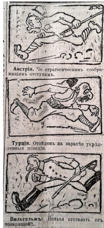
Рис. 12. Австрія. По стратегическимъ соображеніямъ отступимъ. Турція. Отойдѣмъ на заранѣе укрѣпленныя позиціи. Вильгельмъ: Нельзя отставать отъ товарищей! (Южная копейка. – 1916. – 10 августа. – № 2049)

Період кінця 1916 початку 1917 рр. відзначився появою у ЗМІ значної кількості матеріалів, що відображали складне внутрішньополітичне та військове становище ворога. Автори публікацій та зображень наголошували, що Німеччина та її союзники відчувають значний дефіцит продовольчих запасів, фуражу, озброєння та інших необхідних речей для ведення військових дій. Яскравим прикладом подібного пропагандистського матеріалу є карикатура “Кінна” атака”, в якій відображено та висміяно факт відсутності достатньої кількості коней для австро-німецької кавалерії (рис. 13) [17, с. 2].